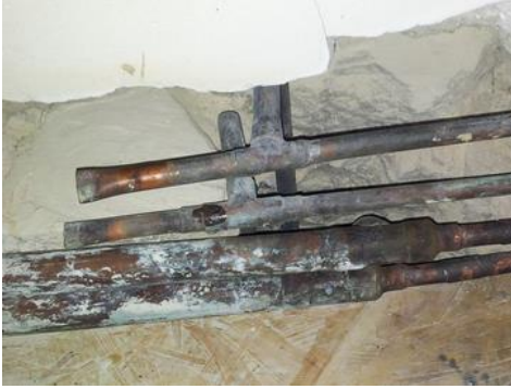
Bras mort sur un réseau d'eau froide et d'eau chaude

Dans les bras morts des réseaux d'eau sanitaire, dans les circuits de bouclage mal dimensionnés, dans les réseaux d'eau froide non calorifugés et soumis à la chaleur, dans les tuyauteries à fort encrassement de tartre.